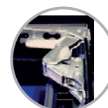
Cerniera professionale "Soft-Close" Professionelles Scharnier