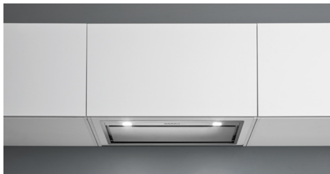
Immagine indicativa del prodotto Potrebbe non corrispondere alla versione selezionata