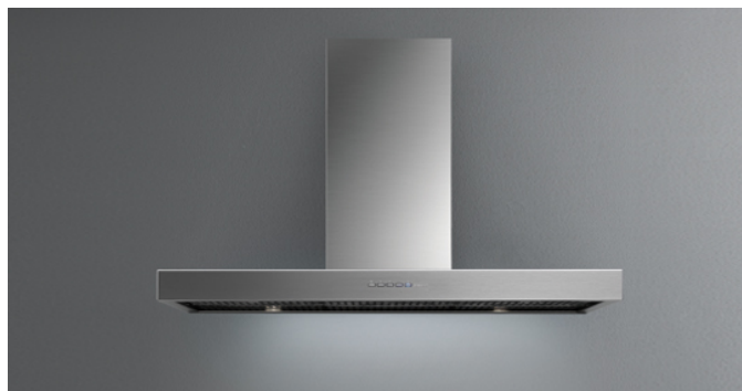
Immagine indicativa del prodotto Potrebbe non corrispondere alla versione selezionata