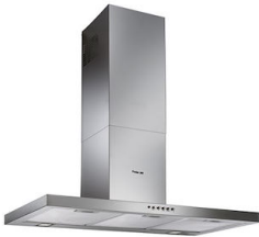
Cappa d'aspirazione KS 240_002