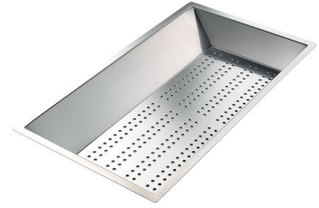
Vaschetta forata inox