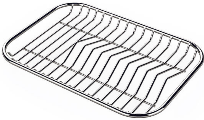
Griglia portapiatti inox