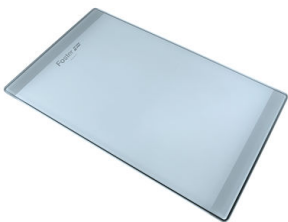
Tagliere in cristallo