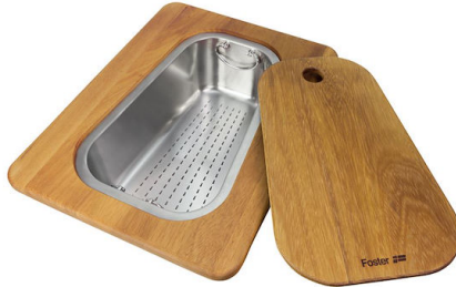
Kit tagliere in legno Iroko con vaschetta scolapasta in acciaio inox