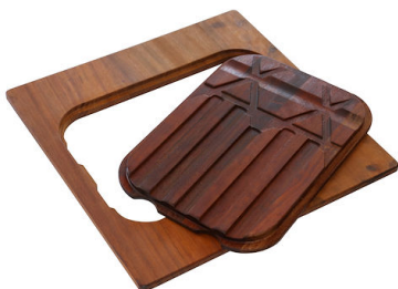
Tagliere Twin in legno Iroko