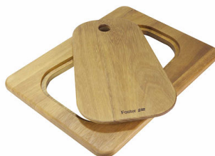
Tagliere Twin in legno Iroko