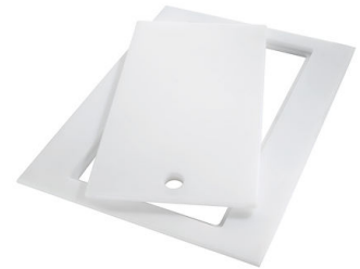
Tagliere Twin in HDPE