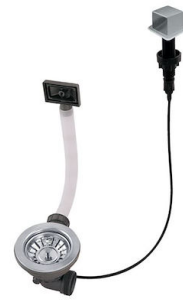
Piletta automatica LIRA