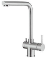
Miscelatore Gamma 3 vie