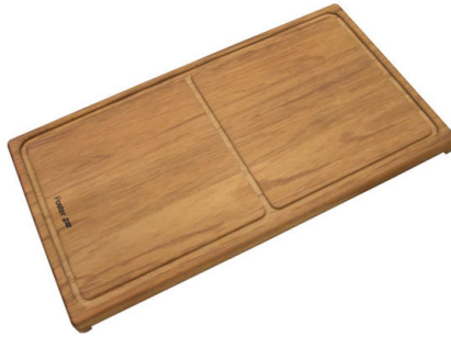
Tagliere scorrevole in legno Iroko