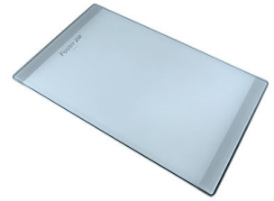
Tagliere in cristallo