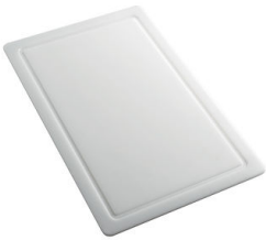
Tagliere in HPDE