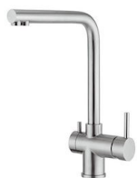
Miscelatore Gamma 3 vie