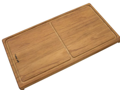
Tagliere scorrevole in legno Iroko