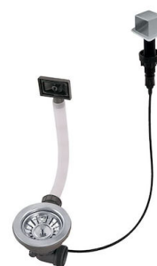
Piletta automatica LIRA