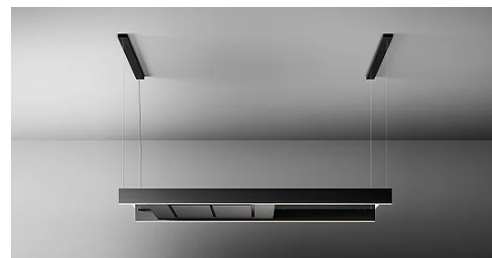
Immagine indicativa del prodotto. Potrebbe non corrispondere alla versione selezionata