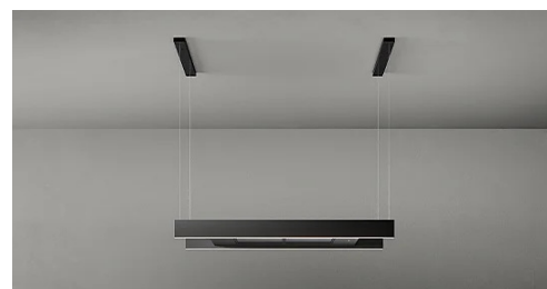
Immagine indicativa del prodotto. Potrebbe non corrispondere alla versione selezionata